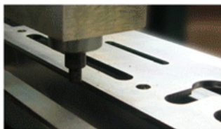
Doble Perno Palpador con Plantilla Standart