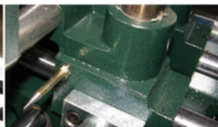
Indicador de Medidas